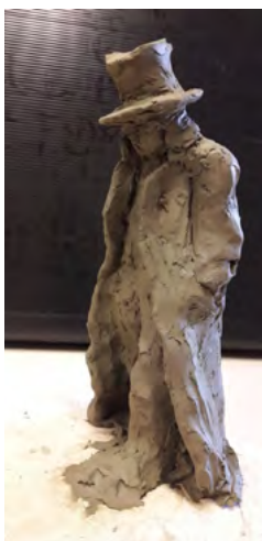
Žiga Gojevič, 2018