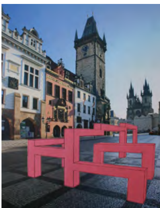
Urška Katanec, 2011