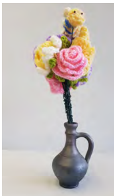
Pija Kotnik, 2020