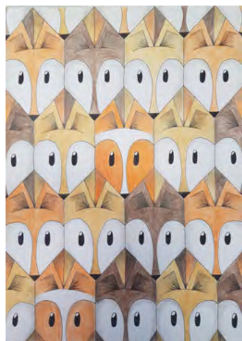
Tia Delopst, 2020