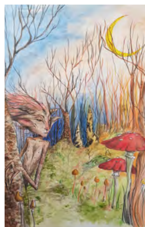
Neža Podpečan Toplak, 2020